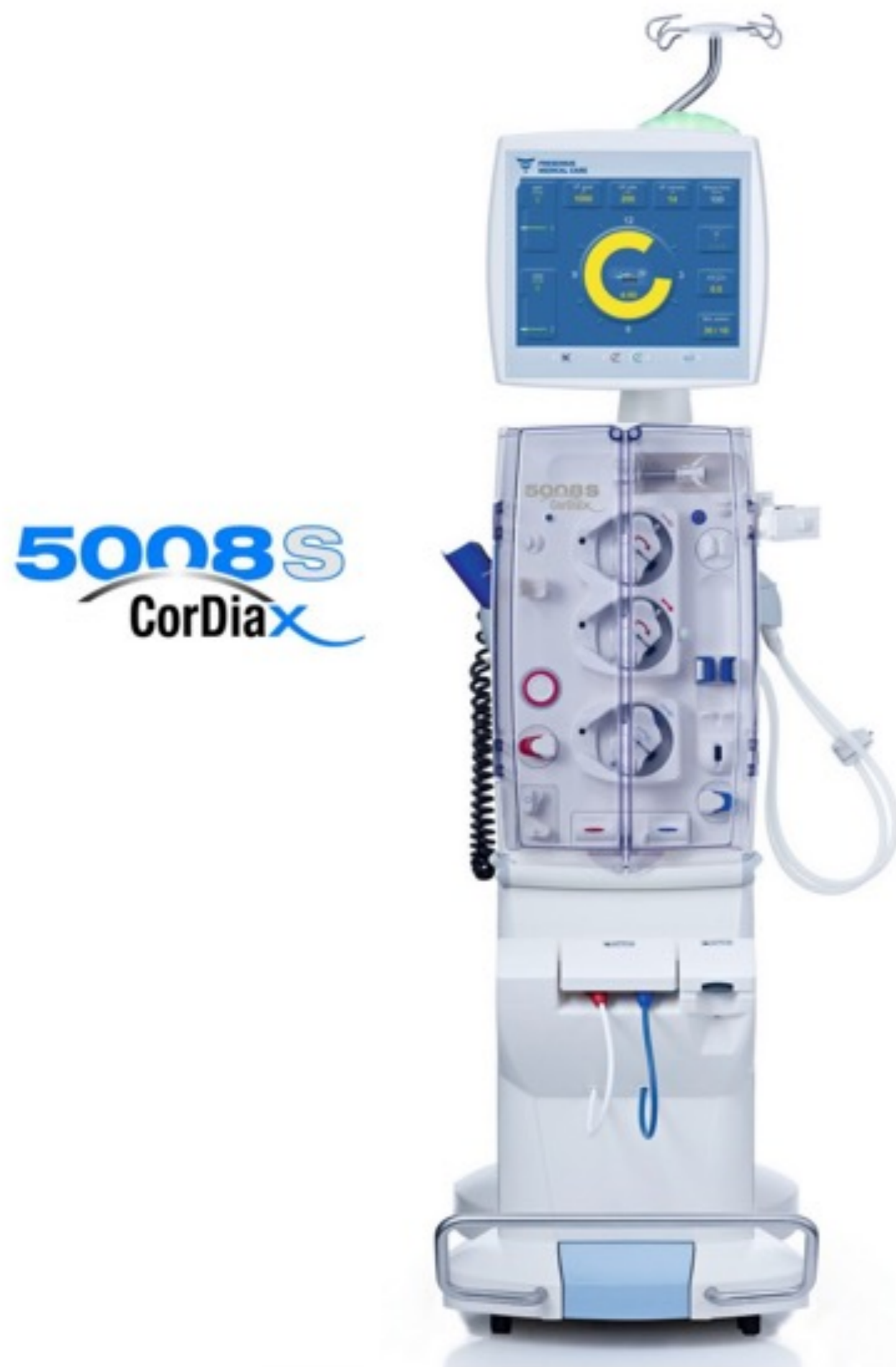
Abbildung 1: Dialysemaschine 508S Fresenius Medical Care (Yim, o.J.)