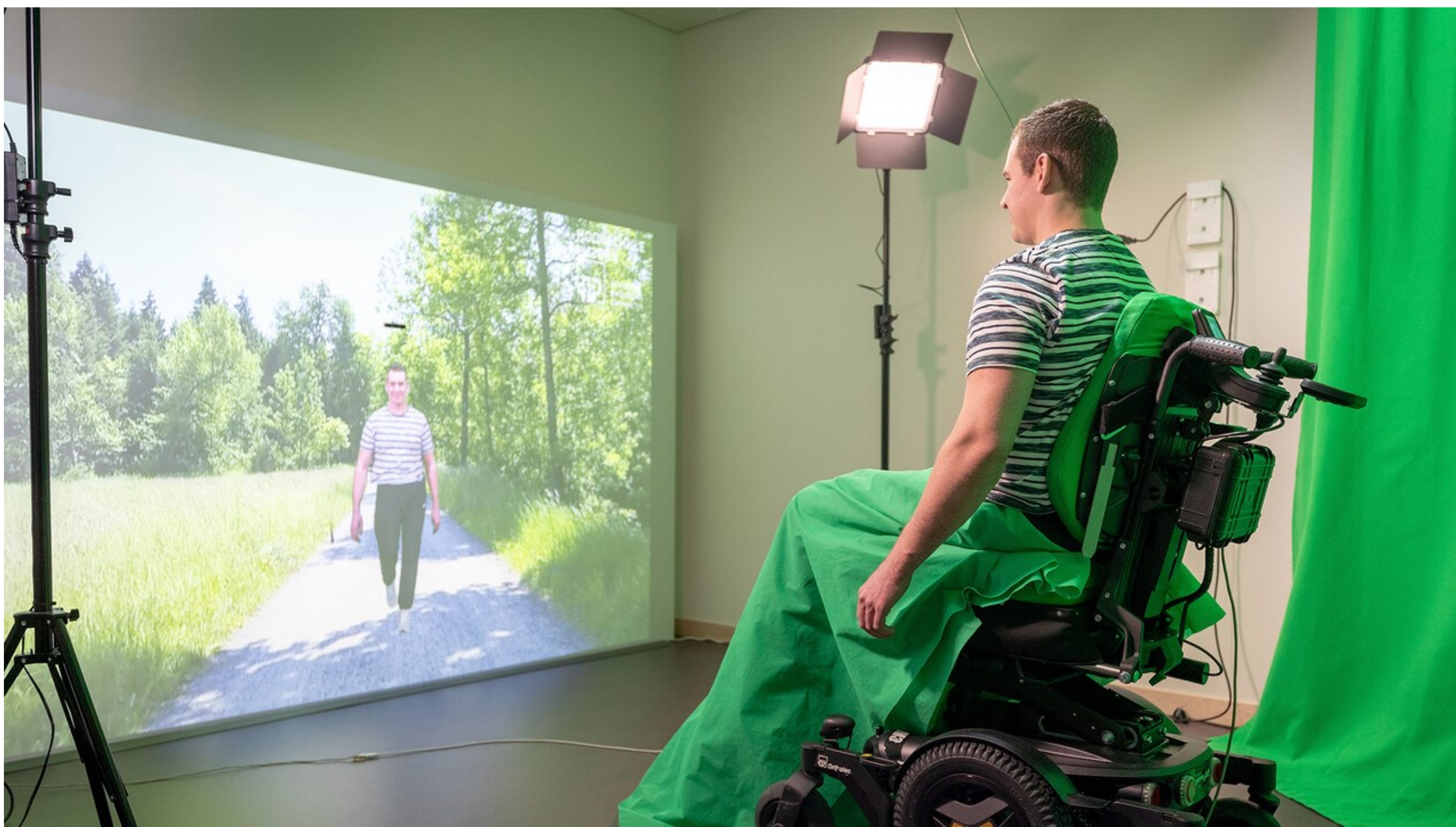
Abbildung 1: Das Medizinprodukt <Virtual Walk>