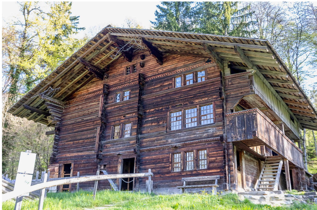
1698 in Adelboden erbaut, 1968 auf den Ballenberg gezügelt – und heute ist die Geschichte dieses Bauernhauses digital zu erkunden.

In seiner Arbeit versteht Kunz das Haus nicht nur als Objekt, sondern als aktiven