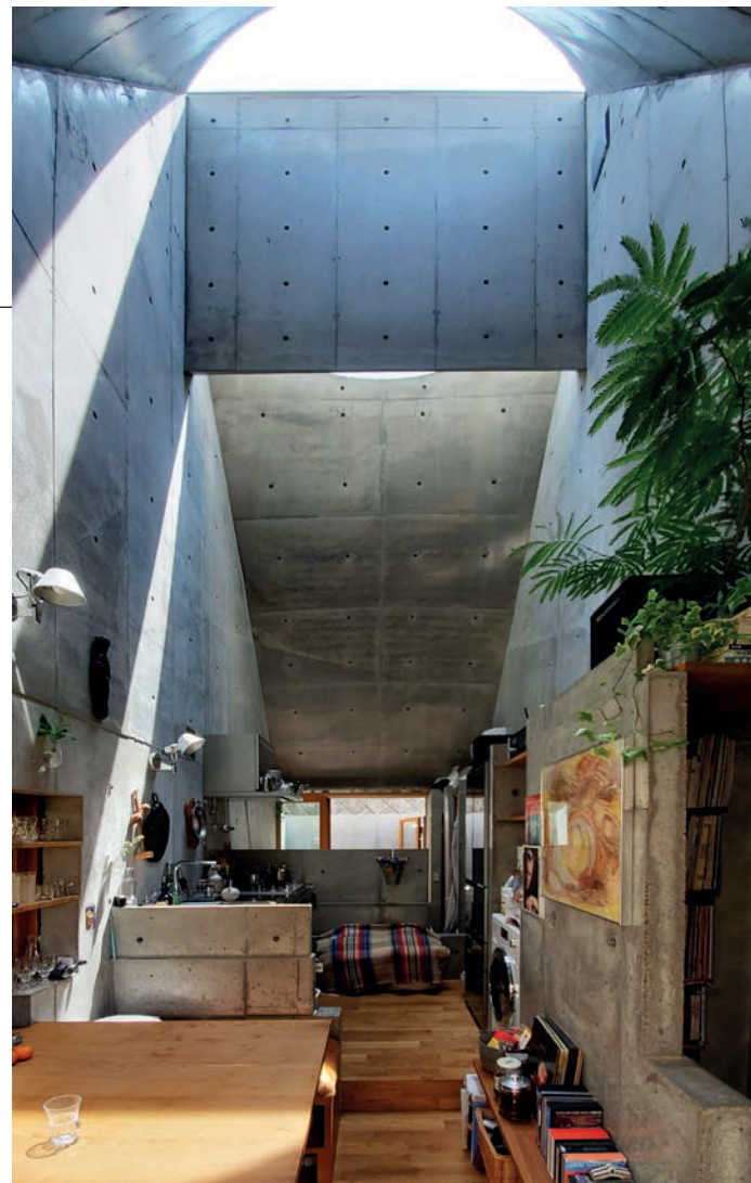
Auf nur 19 m 2 Grundfläche erstreckt sich das neue Zuhause „Love 2 House“ des japanischen Architekten Takeshi Hosaka.

So wird weiter gebaut, aber oft am Bedarf vorbei. Der Wohnungsbestand wächst, während seine gesellschaftliche Passung zurückbleibt. Genau hier zeigt sich das Potenzial von Kleinwohnformen, wie sie im Kontext von KWF erforscht und erprobt werden: als ergänzende Typologien im Bestand, als flexible Einheiten für Übergangsphasen, als reale Alternative zum Entweder-oder von Grosswohnung oder Verdrängung. Nicht als Lifestyle, sondern als strukturelle Antwort auf ein Wohnsystem, das politisch hinter der gesellschaftlichen Realität zurückbleibt. In der öffentlichen Debatte werden Kleinwohnformen häufig romantisiert oder marginalisiert: